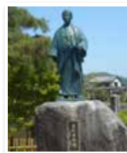
東行庵(高杉晋作像)